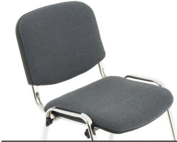
ISO CHROM Stoff