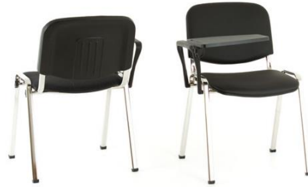
ISO CHROM CO Kunstleder