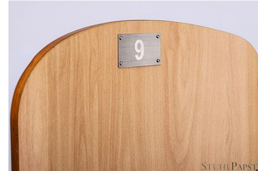
HAR.MONIE Nummerierung schraubbar Groß