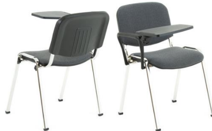
ISO CHROM CO Stoff