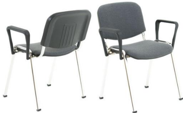
ISO CHROM AL Stoff