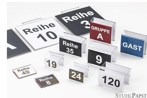
Reihennummerierung Klemme Klein